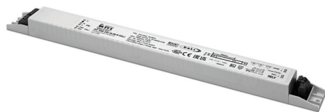
DC 70W 24V SLIM R DALI

Alimentatore da incorporare. Utilizzabile per apparecchi di illuminazione in classe di protezione I. Morsetti di entrata e uscita contrapposti (ingresso: sezione cavo fino a 1,5 mm 2 / AWG15; uscita: sezione cavo fino a 2,5 mm 2 / AWG13). Protetto in classe I contro le scosse elettriche per contatti diretti e indiretti. Fissaggio dell'alimentatore tramite asole per viti. Protezioni: termica e cortocircuito; contro le extra-tensioni di rete; contro i sovraccarichi; fusibile di protezione all'ingresso. Protezione termica = C.5.a.